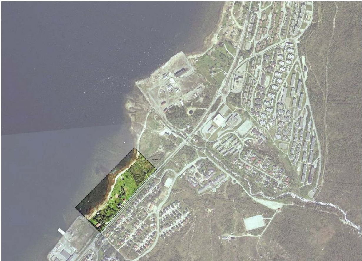
Markeringa viser området som omfattes av igangsatt planarbeid på Krokbakken.

Forslag til nytt områdenavn fremma av Barlindhaug Consult oktober 2006 for området som har navnet Krokbakken, dvs. Tomasjordnes nord og flere, se flyfoto.