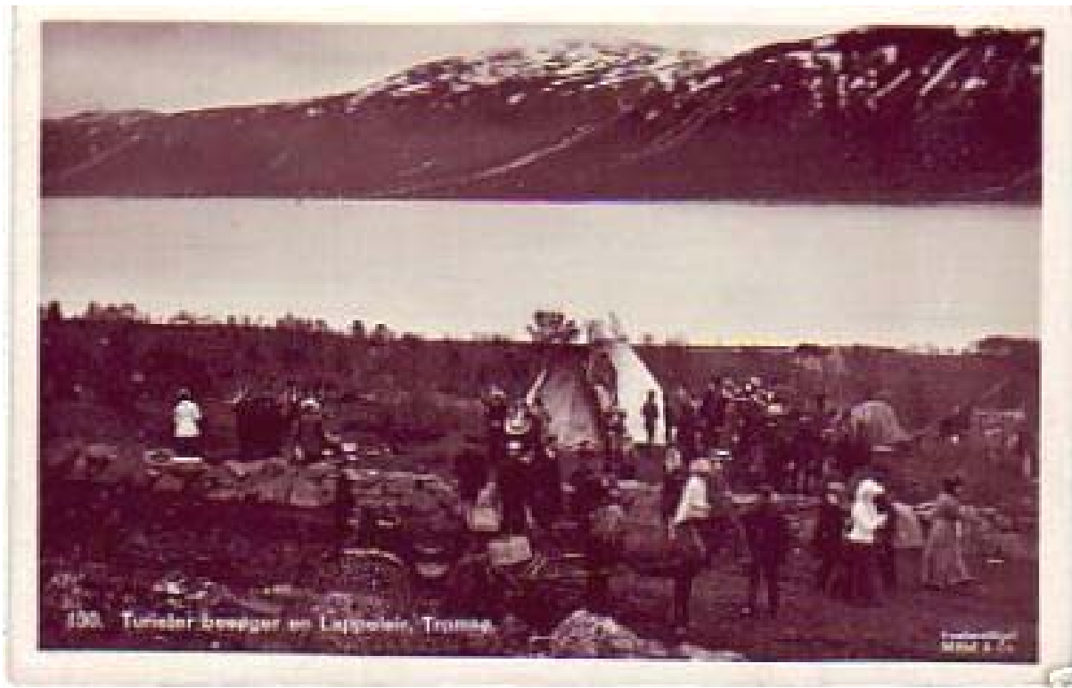
Dette postkortet viser en sameleir satt opp for turister nord for byen på Tromsøya. Legg merke til faret etter den store Regineskrea over Krokbakken på andre sida av sundet.