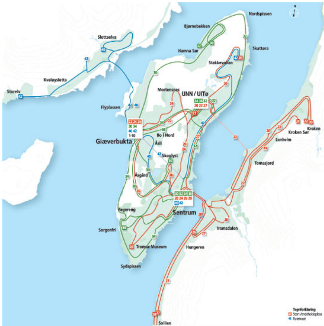
Kart over Bybussruter i Tromsbuss.

Tromsbuss skal bruke navn på holdeplasser godkjent av Troms fylkeskommune. Fylkeskommunen er som offentlig myndighet er pliktig å bruke stedsnavn som godkjente og registrert i SSR.