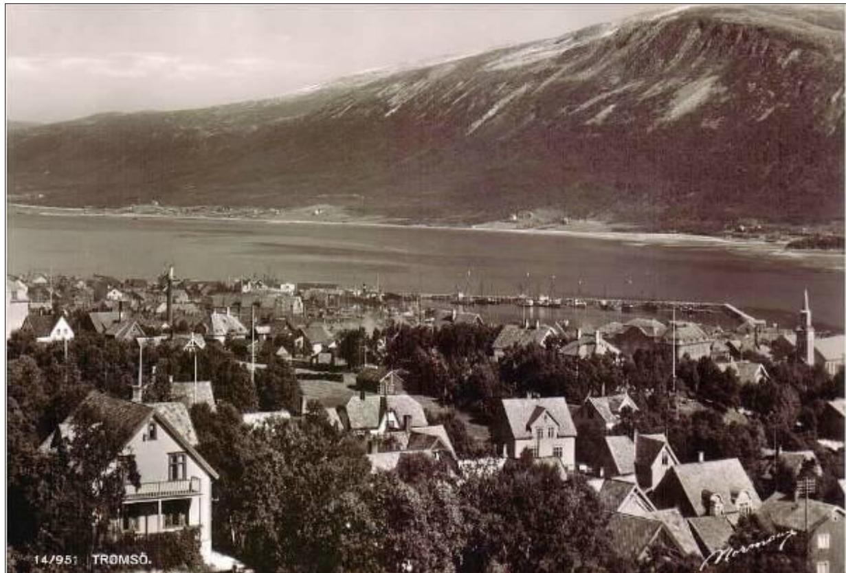
Tomasjordaksla og gårdene på Tomasjorda sett fra Jordbærhaugen, på 30-tallet