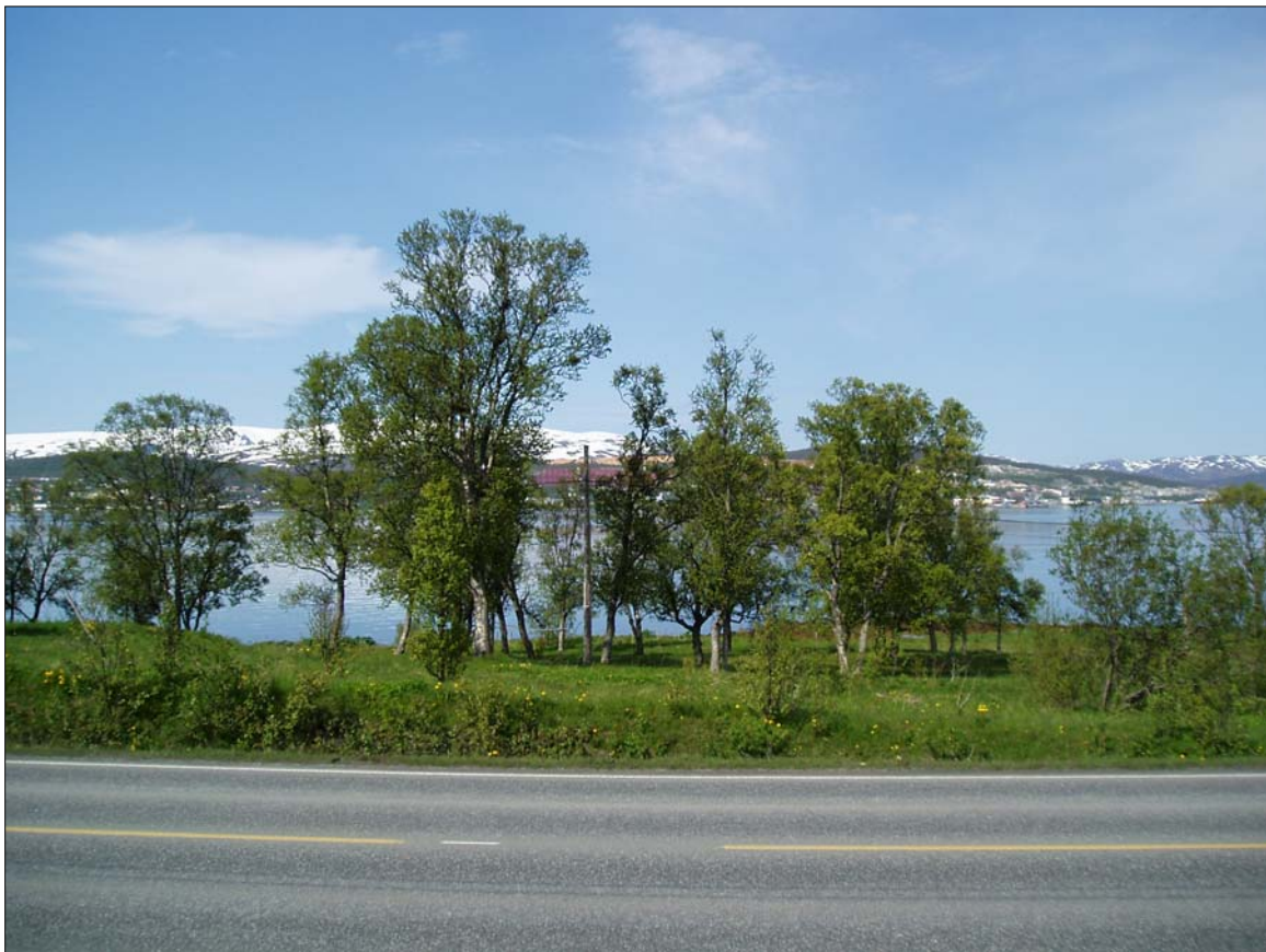
Vakre trær på Krokkbakken, mellom vegen og fjæra og nedenfor oppkjørselen til alpinanlegget